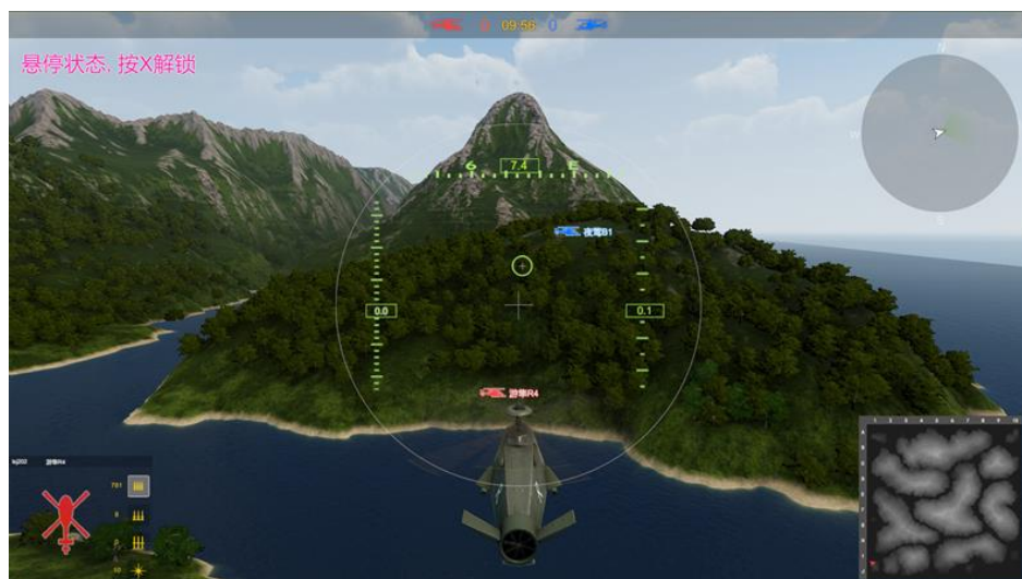
图 4 竞赛系统效果示意（对抗仿真）