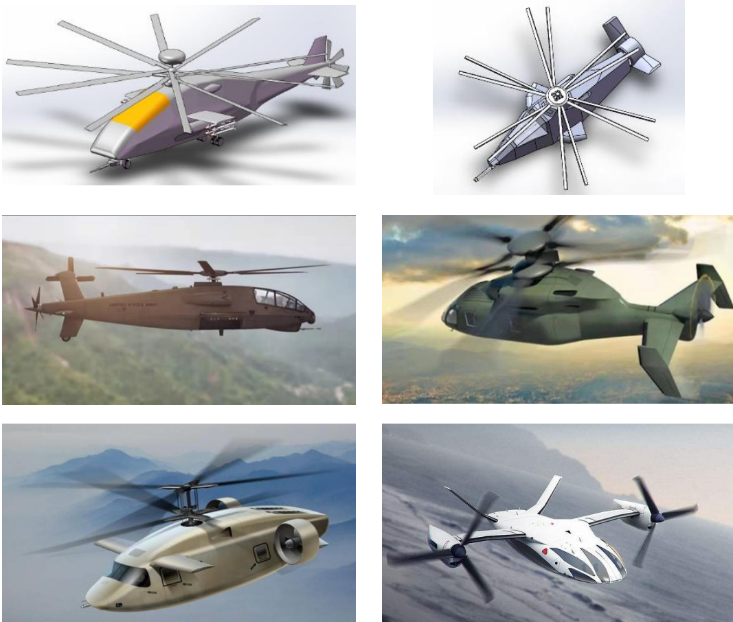
图 5 概念设计方案参考图