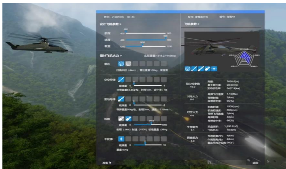
图 3 竞赛系统效果示意（性能设计）

飞行器概念设计与对抗赛以新一代武装直升机概念设计为背景，参赛队根据竞赛要求，完成武装直升机的性能参数(如图 3 所示)和概念方案设计，并将设计的概念飞行器带入到飞行器概念设计对抗仿真竞赛系统（简称：竞赛系统）进行对抗仿真任务验证(如图 4 所示)，包括人-机对抗和人-人对抗两种形式，涵盖典型对空和对地任务场景。