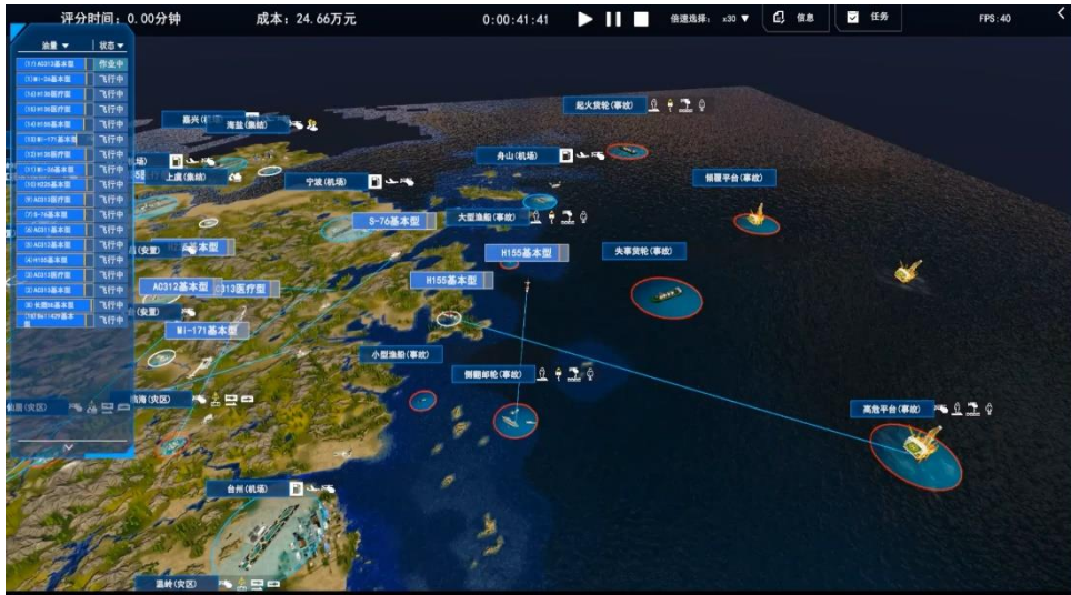
图 2 竞赛系统效果示意（推演仿真）